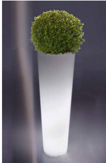
Réf. 134.326A - Bac PVC New Pot Maxi light Ø 44 cm ht 1,20 m avec buis boule Ø 45 cm