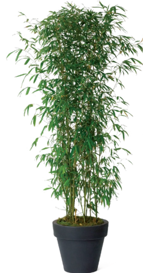
Réf. 111.110 - Bambou touffe ht 1,50 à 2 m Réf. 134.359 - Vase three noir