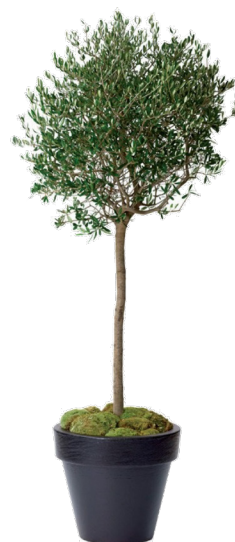
Réf. 112.020 - Olivier Réf. 134.359 - Vase three noir