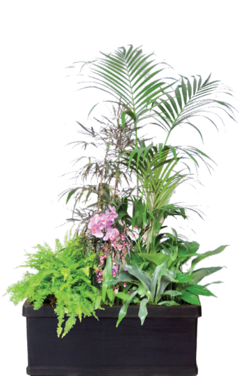
Réf. 143.200 - Bac rectangle noir 100 x 32 cm Composition de végétaux