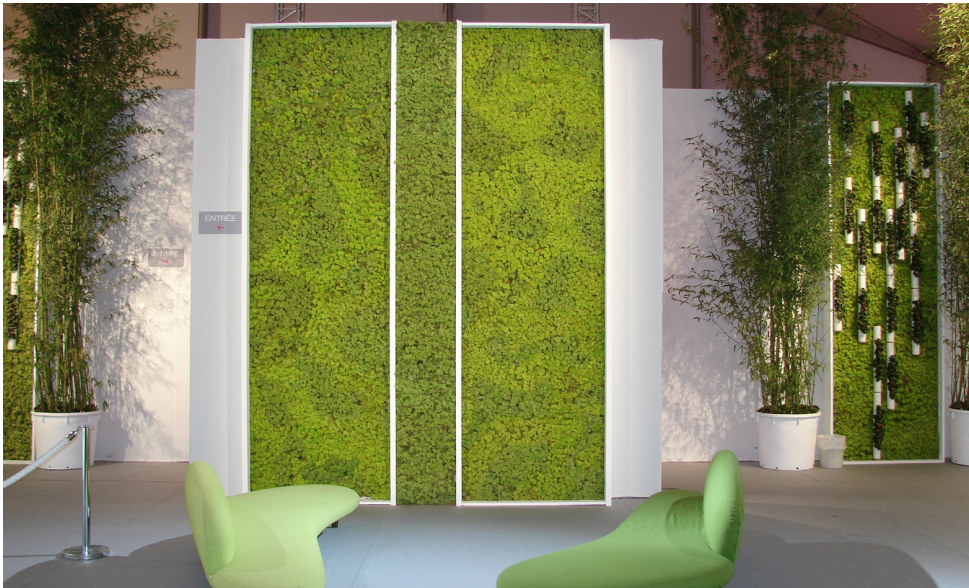
Tarifs sur devis