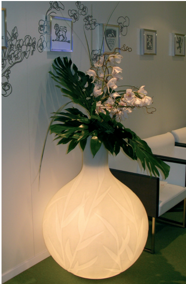
Réf. 134.300B - Bac Princess Light Ø 75 cm ht 1 m avec Orchidées et feuillages