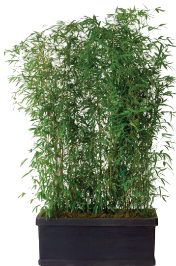
Réf. 142.960 - Bac rectangle noir 100 x 32 cm Haie de Bambous ht 2 à 2,50 m