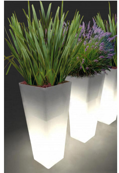
Réf. 134.327A - Bac PVC Kubis ASQ light 46 x 46 cm ht 1,10 m avec Phormiums