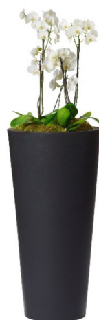
Réf. 113.410 C - Orchidées en bac Partner noir ht totale 1 à 1,10 m