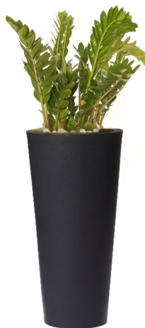
Réf. 113.410 B - Zamioculcas en bac Partner noir ht totale 1,30 à 1,50 m